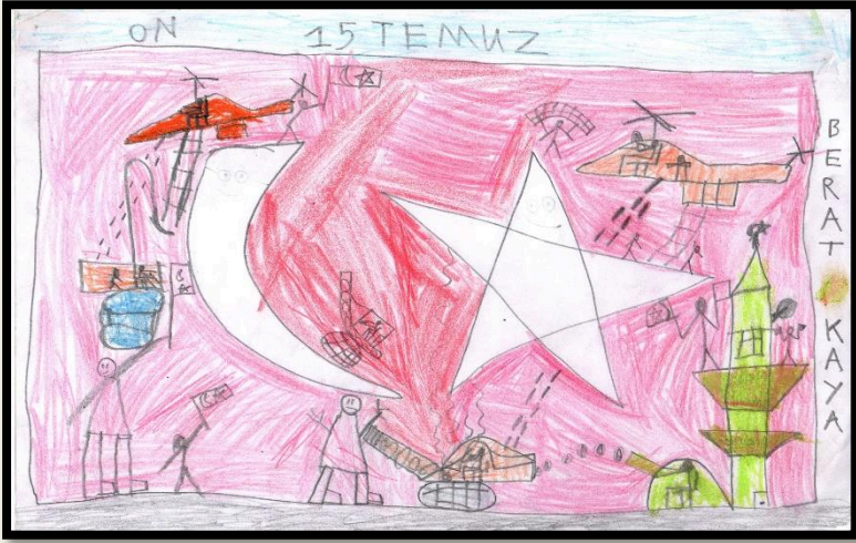
Berat KAYA 3/A (1. Eser )

Okulumuzda İlkokullar arası düzenlenen 15 Temmuz konulu resim yarışmasında dereceye giren ilk üç eseri beğenimize sunuyoruz. Yarışmada dereceye giren öğrencilerimizi tebrik ediyoruz.