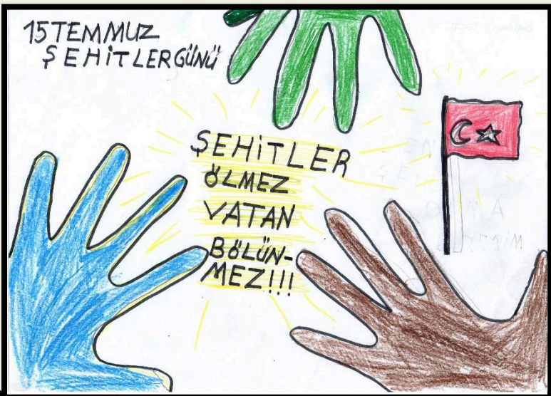
İsmail Doğukan TEKİR 4/A (3. Eser)